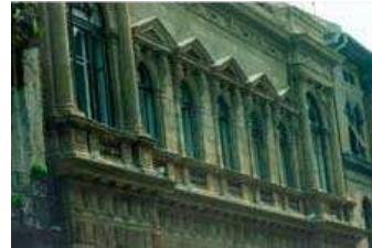
A Történeti Levéltár Eötvös utcai homlokzata

az Állambiztonsági Szolgálatok Történeti Levéltára